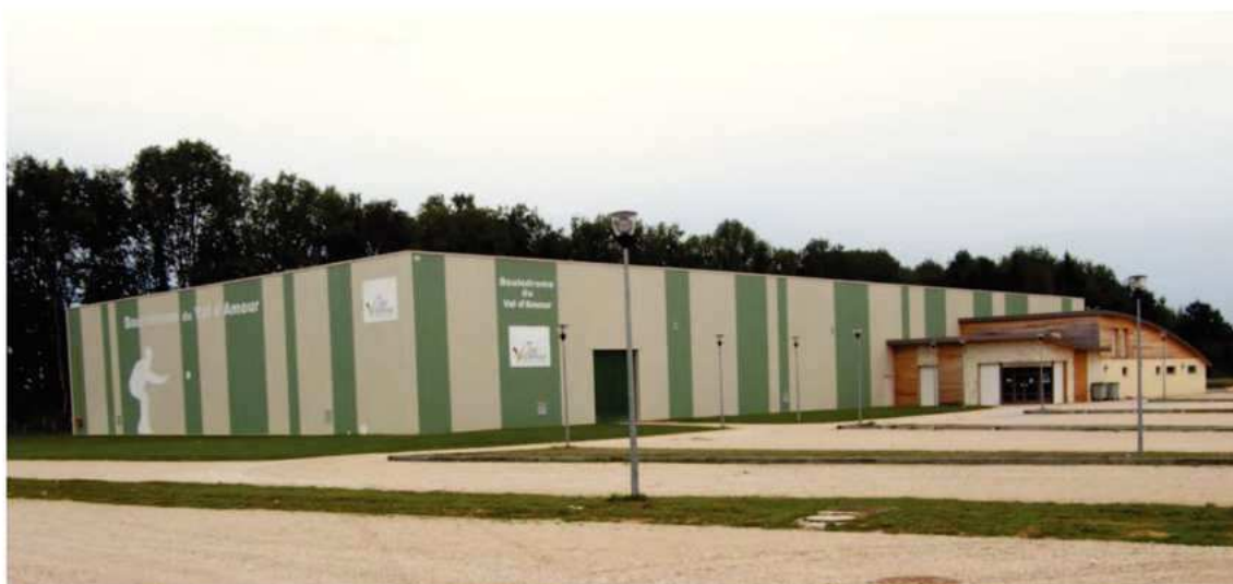
Boulodrome Régional de BANS / MONT SOUS VAUDREY - Siège du Comité départemental 39 FFPJP